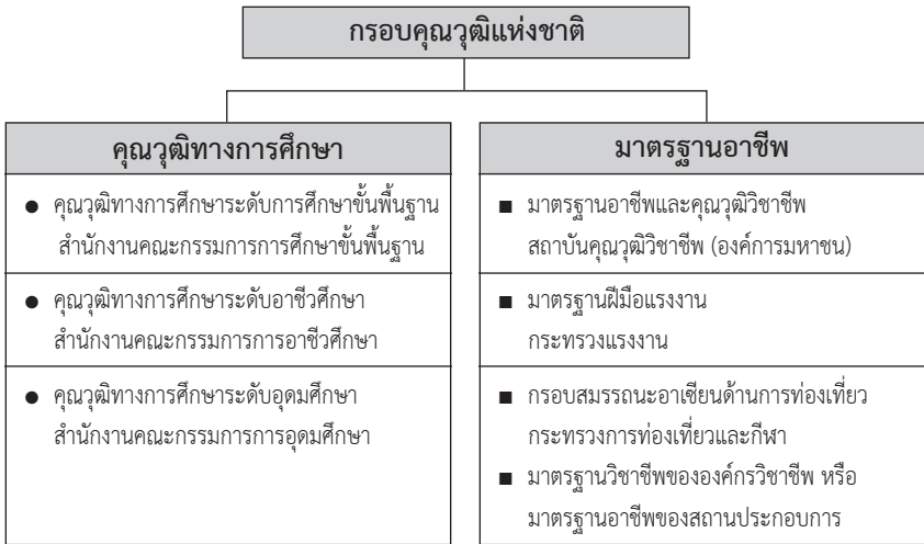
แผนภาพที่ ๑ ความเชื่อมโยงระหว่างคุณวุฒิทางการศึกษากับมาตรฐานอาชีพ